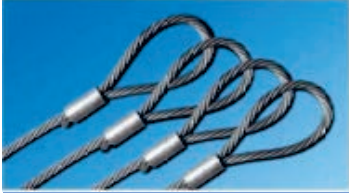
两端眼形钢丝绳吊索尺寸表