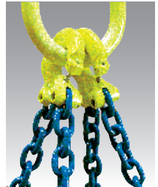
CLD (2 個使用)